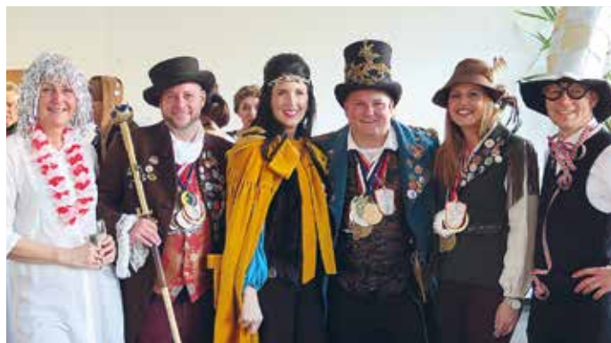
Das Prinzenpaar mit Zeremonienmeister und Gästen beim Faschingskränzle