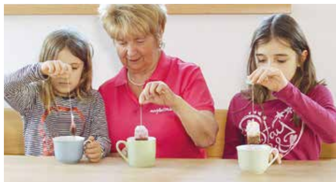
Die KiB-Notfallmama ist auch in Bregenz im Einsatz.

das Kind kümmert. Wo das nicht möglich ist, kommt der Familienselbsthilfverein KiB mit der Initiative Notfallmama ins Spiel. So funktioniert es: unter der Telefonnummer 0664 6203040 ist der Verein rund um die Uhr erreichbar und nimmt den Betreuungsbedarf der Eltern entgegen. Eine Notfallmama, die Zeit für die Betreuung hat, wird gesucht, um Familien bestmöglich zu unterstützen. 2019 wurden in Vorarlberg 30 erkrankte Kinder 253 Stunden lang betreut.