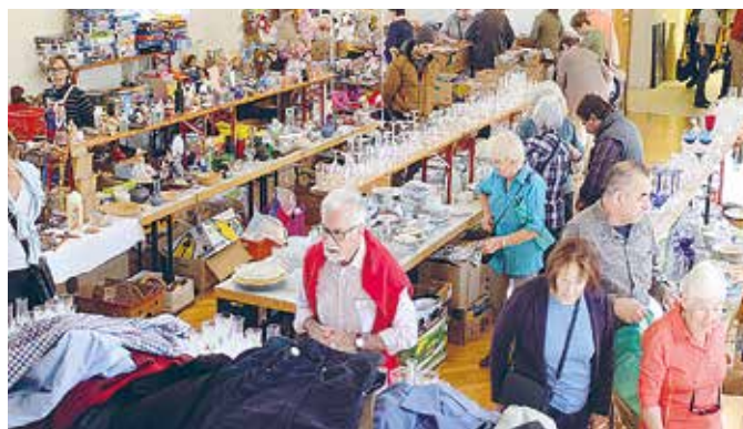
Fundstücke für jedermann und -frau beim Herz Jesu Flohmarkt