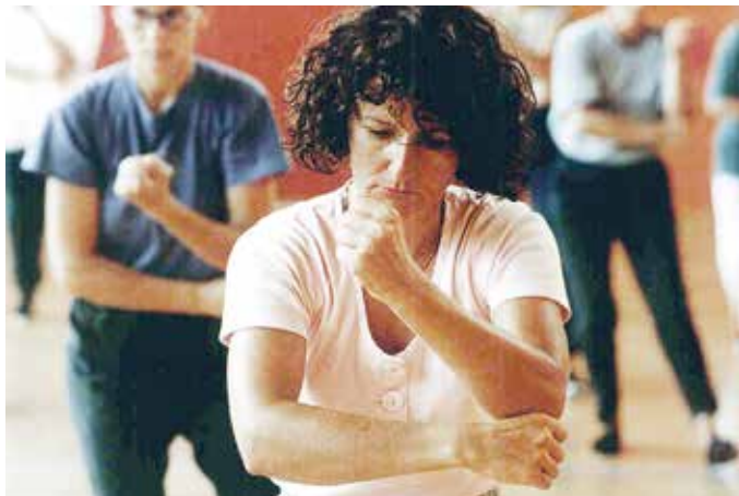
Vielseitiges Angebot beim Studio Drehpunkt-Frühjahrsprogramm