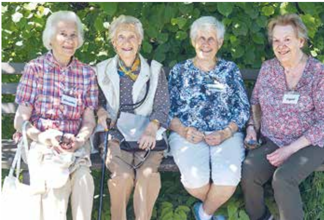
Zufriedene Urlauberinnen bei Ferien ohne Kofferpacken

Im Salvatorkolleg in Hörbranz können Seniorinnen und Senioren ihre Ferien ohne Koffer verbringen und können sogar jede Nacht im eigenen Bett schlafen. Mit dem Taxi werden die Urlauber/innen jeden Tag von zu Hause abgeholt und am Abend wieder heim gefahren. In Hörbranz verbringen Sie in Gemeinschaft eine feine Zeit mit Spaziergängen in schöner Natur, mit Spiel und Spaß. Es werden drei Mahlzeiten angeboten und wer will kann auch ein Mittagsschläfchen abhalten. Begleiter/innen aus dem Lebensraum Bregenz organisieren diese Woche. Finanziell wird das Projekt von der Stadt Bregenz unterstützt.