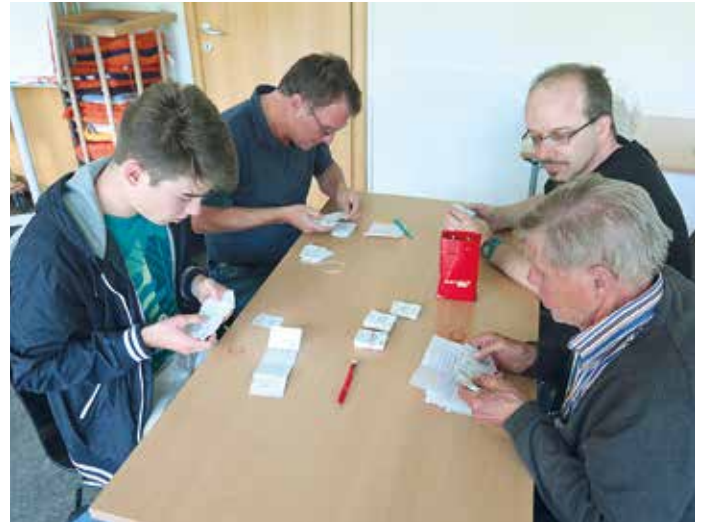
Panini-Tauschbörse vor der Fußball-Europameisterschaft im Juni