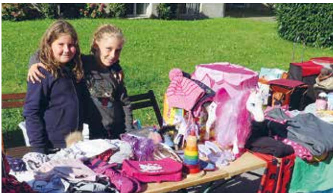
Gut erhaltene Kleidung und Spielsachen beim Kinderflohmarkt

Es beteiligen sich Vereine, Institutionen und Betriebe aus dem Stadtteil Mariahilf, die ein breites kulinarisches Angebot und ein abwechslungsreiches Programm für Jung und Alt bieten. Für Kinder gibt es eine Hüpfburg, einen Radparcours und verschiedene Spielstationen. Erwachsene können bei Integra ihr Fahrrad reinigen lassen, die neuesten Fahrradmodelle der Bregenzer Radhändler begutachten, beim Fahrradmarkt stöbern, sich kulinarisch verwöhnen lassen sowie ein abwechslungsreiches Bühnenprogramm verfolgen und vieles mehr.