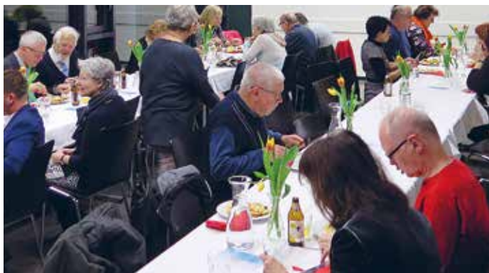
Der informative Abend klang bei feinem Essen aus.

An einem Nachmittag im Fasching organisierte das Stadtteilbüro zusammen mit den Hausbewohnern/innen und dem Lebensraum Bregenz ein Faschingskränzle. Verschiedene Personen, wie Vertreter/innen der Selbsthilfegruppen, Bewohner/innen und solche, die ihrer Tätigkeit im Stadtteilzentrum nachkommen waren angesprochen und eingeladen. Die Gäste erschienen maskiert und das Faschingsprinzenpaar überraschte mit seinem Gefolge. Bei Krapfen, Kuchen und Kaffee samt origineller Faschingsmusik amüsierten sich alle bei bester Stimmung.