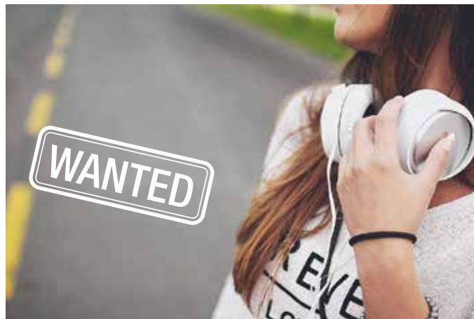
Wir suchen Babysitter – melde dich bei uns.

Das Projekt Frau Holle Babysittervermittlung ist ein Angebot für stundenweises Babysitting. Eine Verschnaufpause für Eltern, Zeit für Einkäufe, Friseurbesuch oder Arzttermin – alles Gründe warum wir Babysitter brauchen.