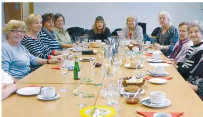
Gemütliche Atmosphäre beim Dienstagfrühstück

Information: Stadtteilbüro Mariahilf, T 05574 410-1668